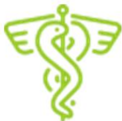
ГУЗ "Елецкая городская больница № 2"